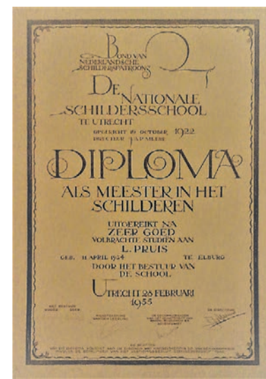
Het diploma van de inmiddels overleden meesterschilder Bertus Pruis