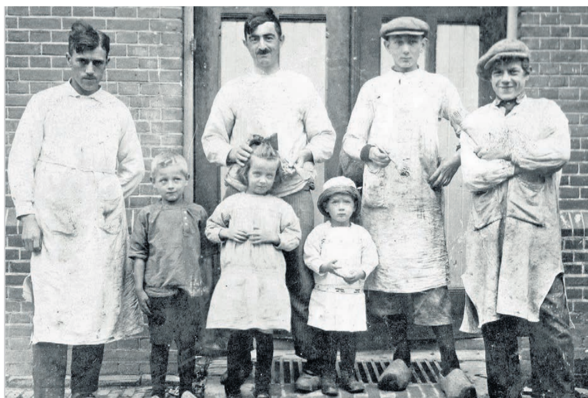
Meesterschilder Broekhuizen uit Elburg met personeel en kinderen. Ze dragen traditionele schildershemden

Mooi voorbeeld van een sector die wel hoge waarde stelt aan een meestertitel is de horeca. Daar is de mogelijkheid gecreëerd dat koks, opgeleid en met ruime ervaring, bij topkoks in toprestaurants voor een commissie van meesterkoks een proef kunnen afleggen en daarmee de titel meesterkok verwerven. Niet alleen in de horeca zelf, maar ook bij het brede publiek staat de titel meesterkok hoog aangeschreven. Het is aan de bedrijfstak zelf of men de nu niet beschermd meestertitel opnieuw invulling wil geven.