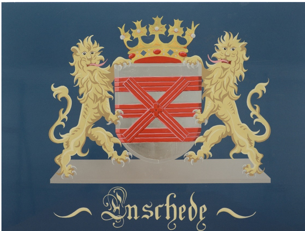
2016 Wapen Enschede Willem Rep