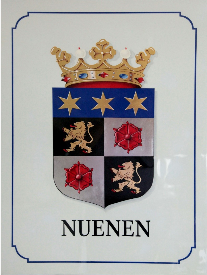
2012 Wapen Nuenen Erika Kunath 2e prijs