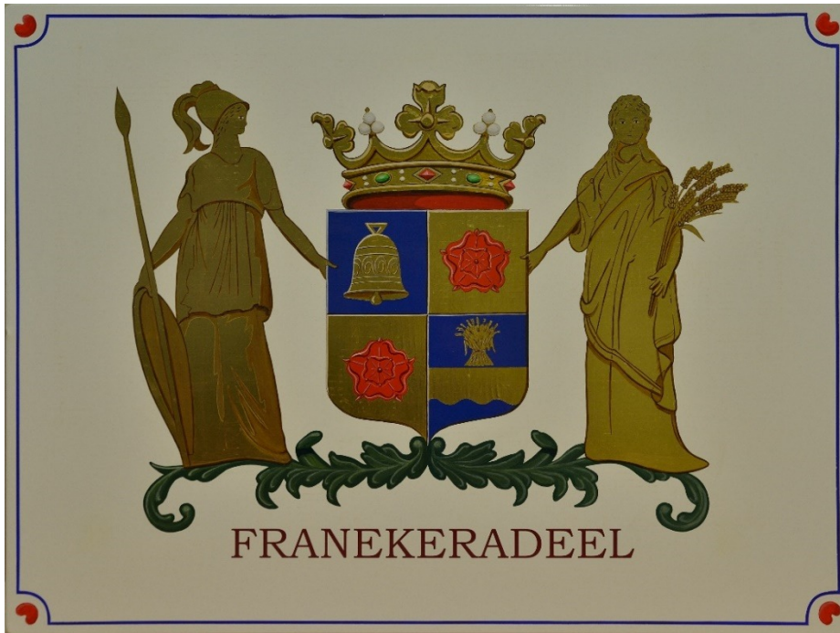
2017 Wapen Franekeradeel Jaap Wieringa 1e prijs C1 _©JEZ_0887