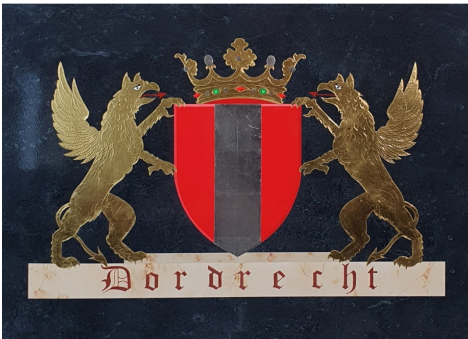
2020 Wapen Dordrecht 3 de prijs Wiebren Dijkstra