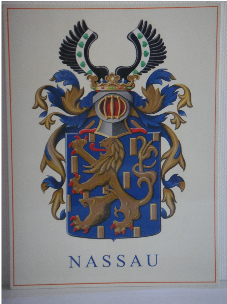
2010 Wapen Oranje Nassau Jaap Wieringa 3e prijs C1 motto Oranje-Nassau