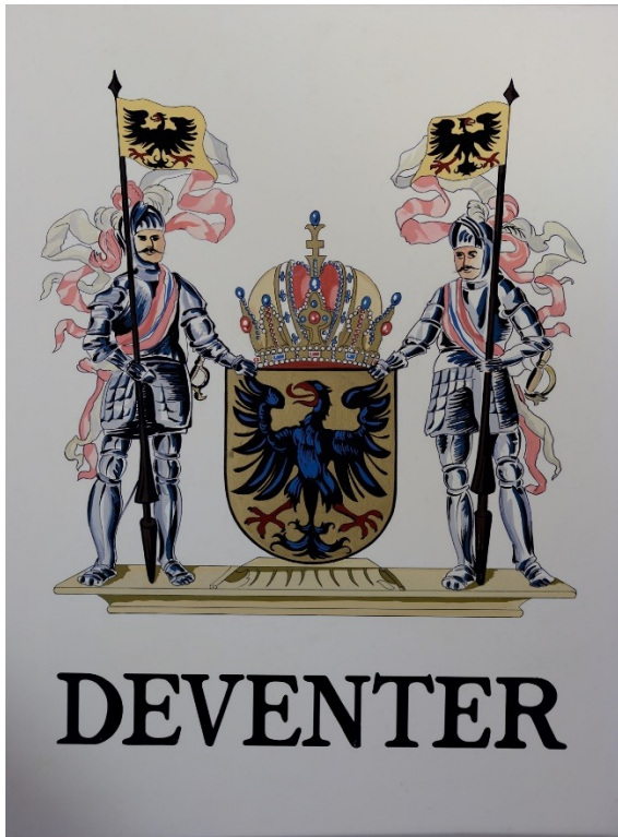
1988 prijswinnaar Wapen van Deventer Piet van Huizen.