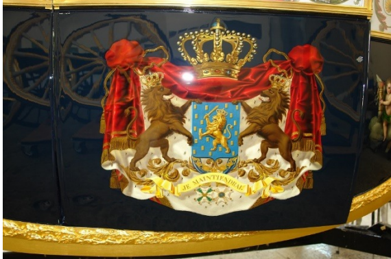
Wapen van het koninkrijk der Nederlanden op de glazen koets.