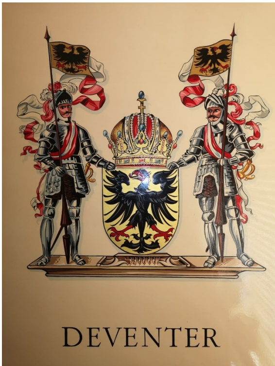
1988 1steprijs SCS J.Hagedoorn