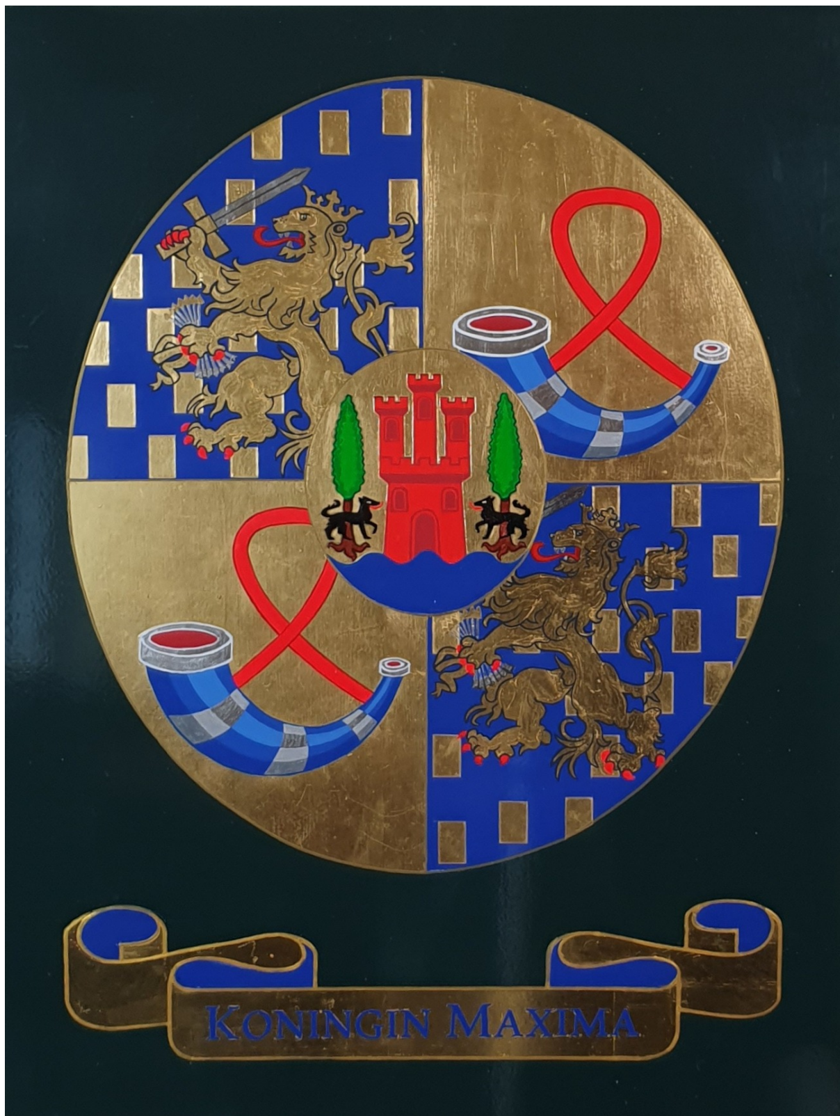
2021 Wapen van Koningin Maxima 1 ste prijs Wiebren Dijkstra