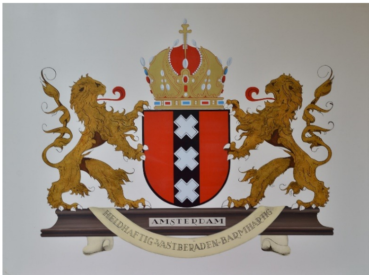
1991 Wapen Amsterdam Jelle Zijlstra nominatie motto Paradiso