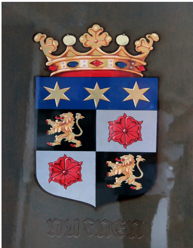
2012 Wapen Nuenen Remon Reijen 3e prijs motto En nu