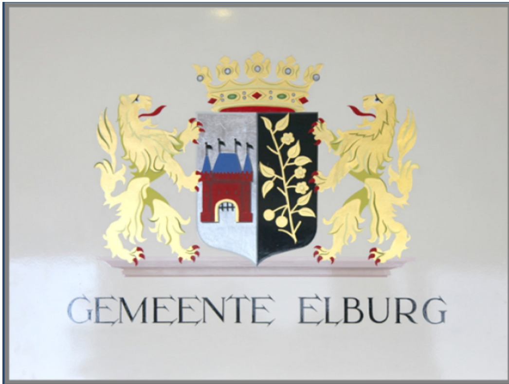
2015 1 steprijs SCS G.v.d.Wielen.