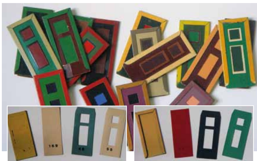
▲ Een ingenieus systeem maakt het mogelijk verschillende kleuren van de deur, kozijn, paneel en schaaflafzetting te combineren.

VAROSSIEAU & Cie. N.V. OPGERICHT 1795 ALPHEN a/d RIJN TELEFOON 50