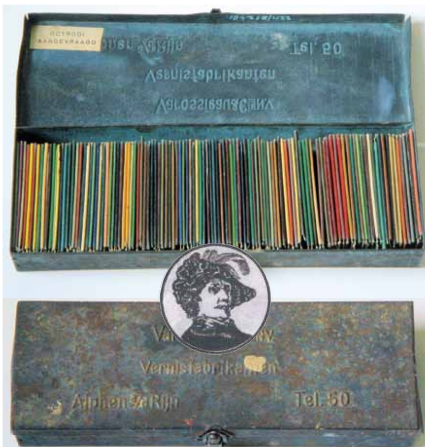
▲ De stalen doos van vernisfabriek Varosseau met meer dan 190 miljoen combinaties aan kleurmogelijkheden.