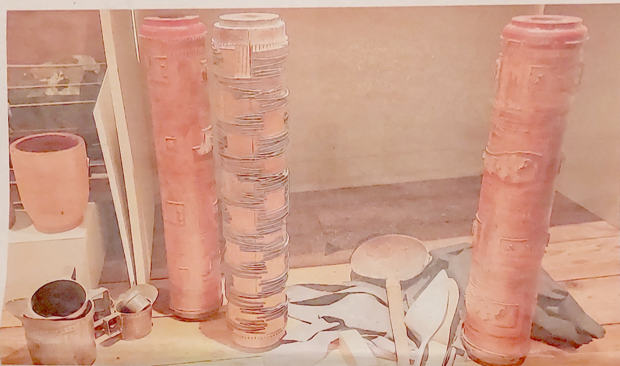
Druktollen voor behang.

Nederland kent zo'n duizend officiële musea, en daarnaast een groot aantal officieuze. Welke verborgen pareltjes zitten daartussen? Vandaag: het Schildersmuseum Elburg.