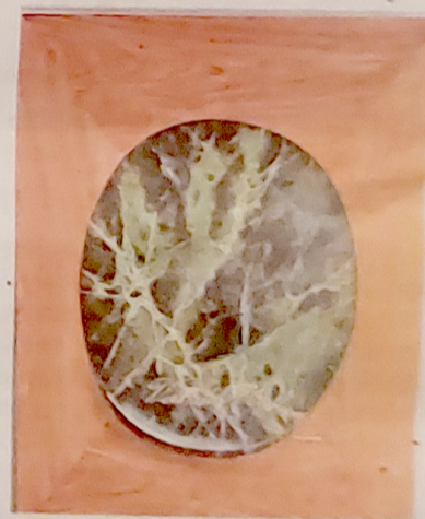
Proeve van hout- en marmerimitatie.

... wilt weten hoeveel specialismen er schuilgaan onder de paraplu van het schildersvak. Letterschilderen, marmer en hout imiteren, brandschilderen, schepen en rytuigen schilderen, behang decoreren ... Verder kom je het nodige te weten over de historie. Zo is er een informatiebord gewijd aan de ontwikkeling van het beroepsonderwijs. Na 800 jaar werd in 1798 het gildesysteem afgeschaft, omdat dit volgens de Bataafse Republiek niet strookte met het ideaal van vrijheid, gelijkheid en broederschap. 'De schilders hebben zich daar lang tegen verzet', weet Anton van Wezep. De schrijver-schilder Jacobus van Looy (1855-1930) leerde het ambacht dus als nederig hulpje van een huis- en rytuigschilder. Pas eind negentiende eeuw kwam er weer iets als beroepsonderwijs op.