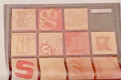
'Die Vergoldung mit Goldgravur'.