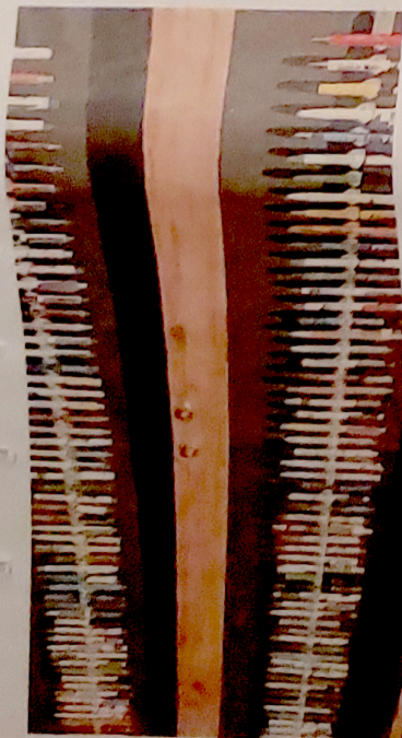
Ballpoints van schildersbedrijven.