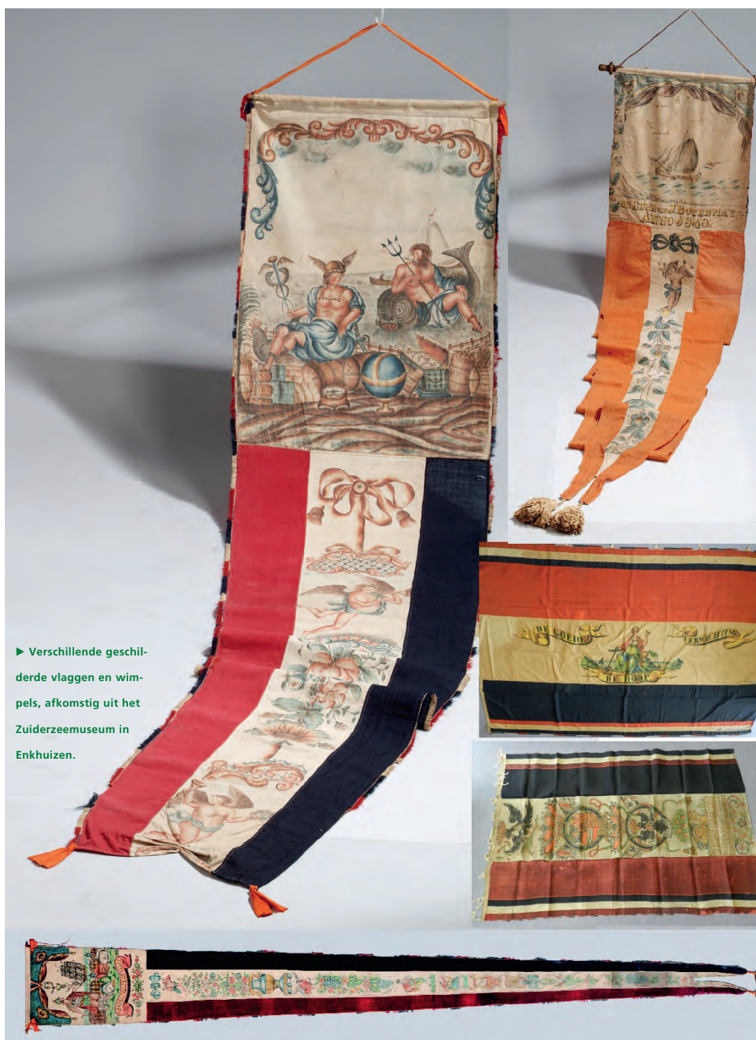
► Verschillende geschilderde vlaggen en wimpels, afkomstig uit het Zuiderzeemuseum in Enkhuizen.

Zeefdrukken en - veel later - digitaal inkjetprinten hebben het inmiddels vrijwel volledig verdrongen, maar eeuwenlang werden wimpels, vaandels en vlaggen geschilderd. Dit werd in het verleden door de schilder gedaan. Het pand waarin het Schildersmuseum in Enkhuizen is gevestigd, getuigt daar nog van.