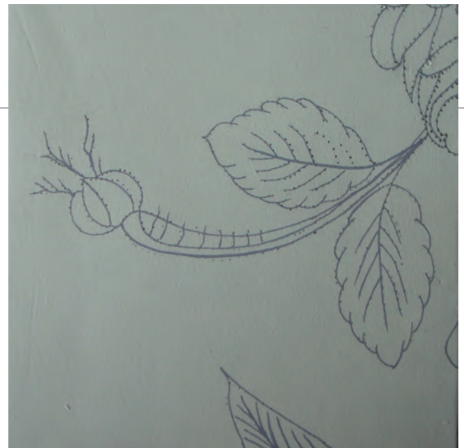
▲ Met een fijne letterzetpenseel worden de contouren op het doek neergezet.

De samenstelling van de gebruikte verf is op basis van pigment gewreven in papaverolie, omdat de lijnolieachtige producten te sterk vergelen. Deze verf moet schraal zijn, dus verdunnen met terpentijn of terpentine. De verf mag niet echt doorharden. Om dit te voorkomen, werd 1/8 deel keukenstroop toegevoegd; het gevolg is wel dat de verf veel langzamer droogt.