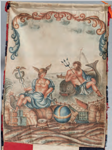
▲ Detail van een voorstelling op een wimpel.

weergegeven. Op de gevel prijkt nog altijd de naam van J. Haanraads.