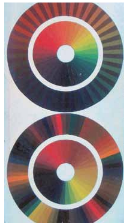
▲ Een bedreven meesterschilder stelde zijn eigen kleurschema's samen. Achterop ieder genummerd vel werd de samenstelling van kleuren vermeld.