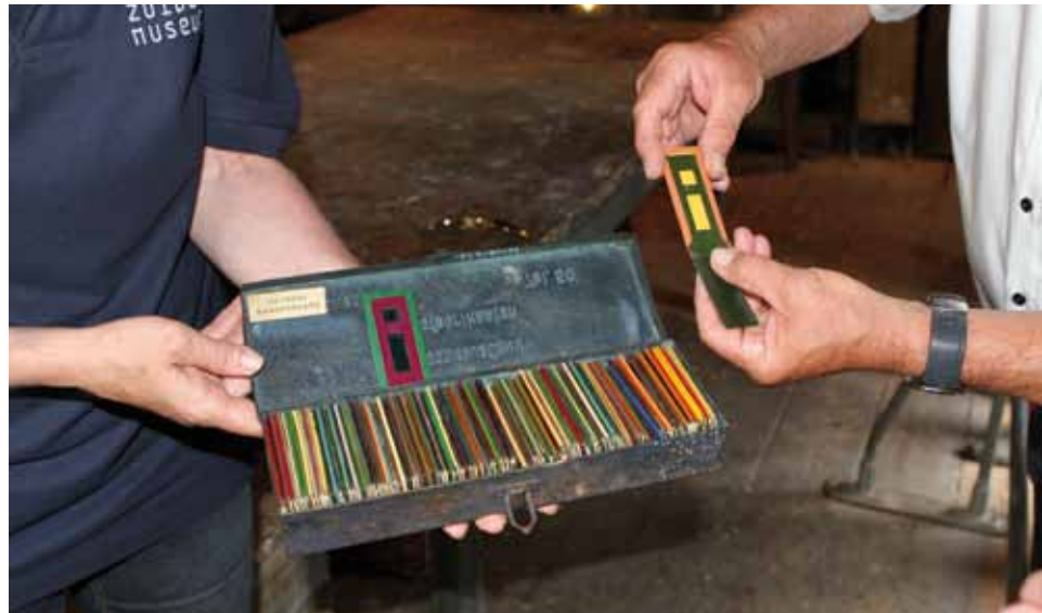
▲ Demonstratie van de 'kleurencombinator' van Varossieau.

Eind negentiende eeuw was het niet gemakkelijk om aan de opdrachtgever een visueel kleuradvies te geven. Het Schildersmuseum in Enkhuizen bezit een aantal objecten waarmee schilders en fabrikanten in de periode 1870 tot circa 1930 inzicht gaven in de mogelijkheden op kleurgebied. Een stukje cultureel erfgoed.